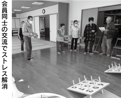
会員同士の交流でストレス解消

会されていない方に声を掛け勧誘を行いました。結果、若い方々の入会が増え会員増へとつながったものと思います。当会は、降雪前の火曜、金曜に輪投げ等を行っています。お