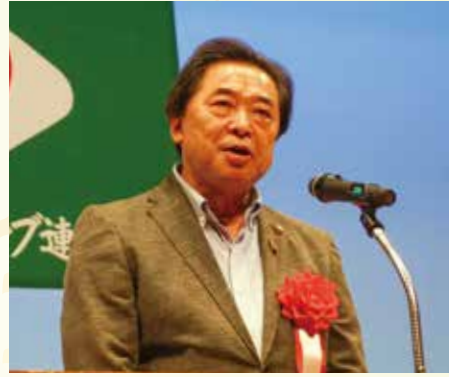
内谷長井市長の歓迎のあいさつ