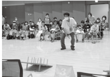
ふるさと少年教室

整備、グラウンド・ゴルフ大会、ワナゲ大会、ふるさと少年教室（小学生との異世代間交流）、いきいきフェスティバル、女性委員研修会などを行っています。また、具体的な活動内容の一つとして、「歌声なの花」と