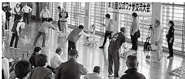
200名以上が参加したワナゲ交流大会

さわやかな秋晴れのもと、10月13日(金)、ヒルズサンピア山形体育館で4年ぶりに公式ワナゲ交流大会が開催されました。県内外から46チームの選手・補欠213名が参加。選手たちは、コロナ禍で中止となった3年間に感染予防対策をしながら地域で地道に練習を行い、輪を投げる技と狙う場所の攻略方