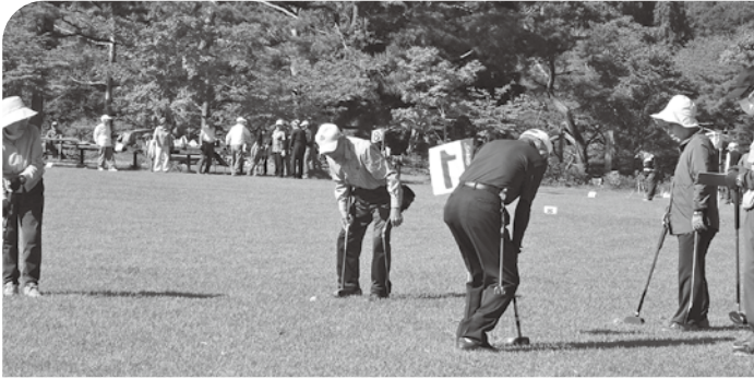
会員の皆さんの「楽しかった、喜びです」

長井市は「水と緑と花のまち」と言われており、春の桜に始まり秋の萩まで花を楽しめます。また、9月5日の県老人福祉大