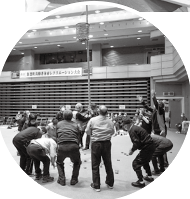
飯豊町レクリエーション大会に参加

会されていない方に声を掛け勧誘を行いました。結果、若い方々の入会が増え会員増へとつながったものと思います。当会は、降雪前の火曜、金曜に輪投げ等を行っています。お