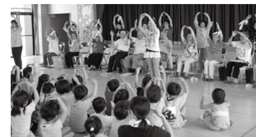
歌声なの花と園児との交流会

いう高齢者によるコーラスの団体があります。平均年齢80歳を超えているにも関わらず、毎月2回の練習と年数回の発表の場で日頃の成果を発揮しております。ピアノの準備からすべて自分たちで行っています。みんなが集まるのが「楽しい」と言って、笑顔あふれる活動になっています。