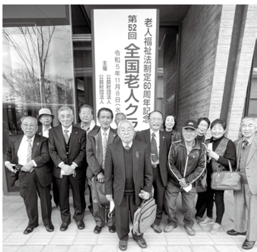
あきた芸術劇場ミルハス前で撮影

1日目の式典では、全国老人クラブ連合会の会長表彰が行われ、本県から庄内町老人クラブ連合会と東根市新町双和会の2団体が受賞しました。仲間の栄えある受章に参加者一同、