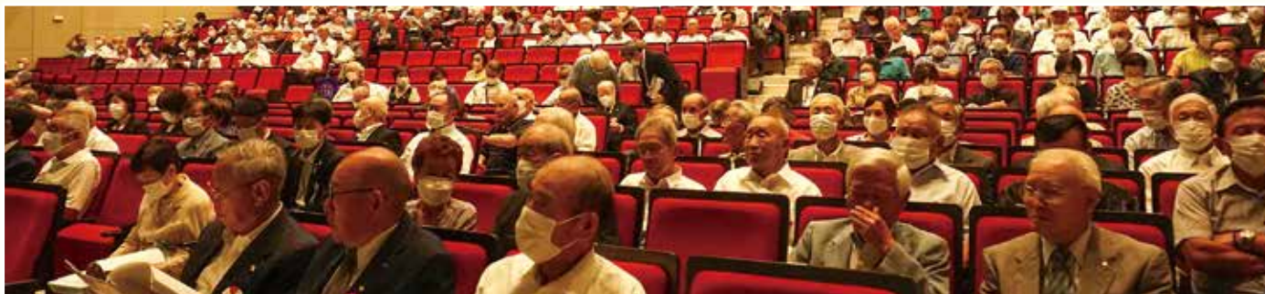
多くの方が駆けつけました

オープニングや式典における表彰・感謝状授与、大会宣言など会場の様子は8～9ページでご紹介します。