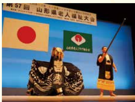
總宮神社黒獅子(左)と警固(右)

に貢献された方々に対し、表彰状が贈られました。今後ますますのご活躍をご祈念申し上げます。 地域共生社会の実現に向け、連携強化を図ることを目的として、水と緑と花のまち長井市に老人福祉関係者が集いました。 “幸せやまがた”の実現を目指し、参加者は連携強化の決意あらたに、本大会は盛会裏に幕を閉じました。