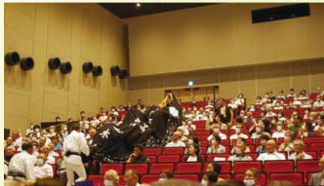
客席内を練り歩く黒獅子