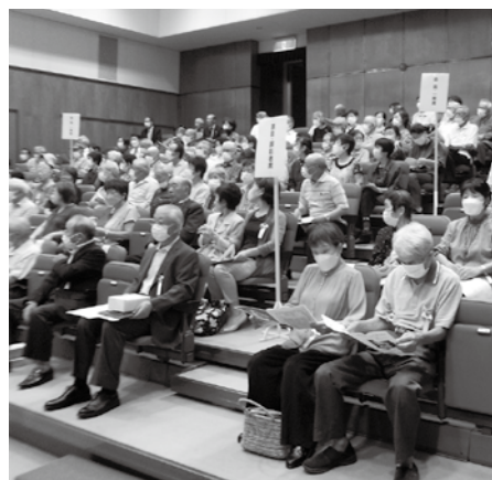
クラブ会員や一般市民の方々