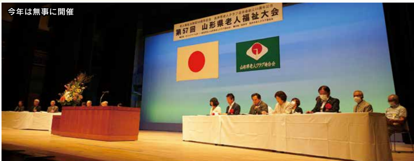
今年は無事に開催