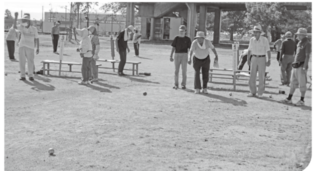
ペタンク大会などさまざまな大会を運営

らず、高齢の人しかいない」と言うのをよく聞きます。声掛けもしているようですが、なかなか難しいようです。今後、若い人もですが、まだ加入していない方にも加入いただき、老人クラブが活性化してくれたいと思います。