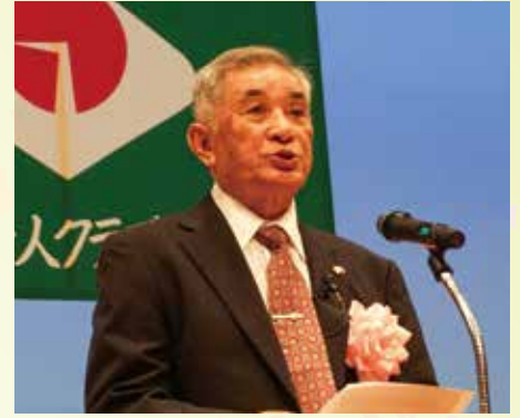
岸部県老連会長の式辞