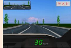
③ハンドル操作検査

画面中央にマーク（赤・黄・緑3色）が出たらそれぞれ違うペダル操作を行い、その反応時間を調べる検査（簡単な検査）