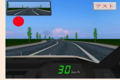
④注意配分・複数作業検査

波状路に沿ってハンドルを操作しながら、画面四隅に3色マークが出たらそれぞれ違うペダル操作を行い、その遂行能力を検査（複雑な検査）