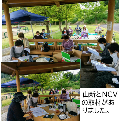
山新とNCVの取材がありました。

8月24日「うたごえ喫茶」で総合公園にバス旅して歌いました。山の下は30度を超す気温ですが森では涼しくてさわやかな風が吹いていました。公民館では歌えませんが大きな声で歌いました。東屋と脇の木の下に陣取って位置を離して座りました。テーブルナプキンをフェースバルにして飛沫防止をしました。歌う場所はけがの功名で公民館だけでなく外で歌うのいいなと思えました。